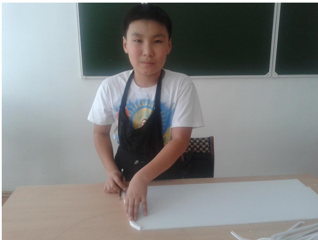
Уықтарын жасау сәті