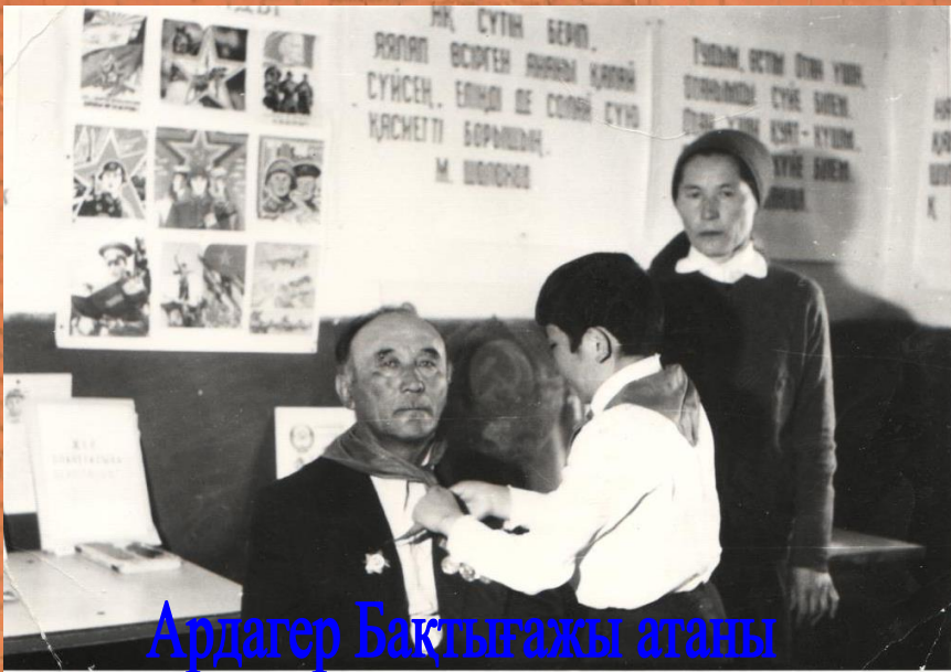
Ардагер Бақтығажы атаны салтанатты түрде "Құрметті пионер" қатарына қабылдау үстінде. 1984 жыл.