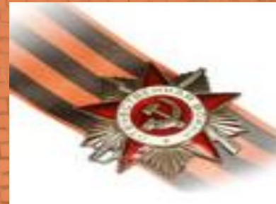
І дәрежелі «Отан соғысы» ордені.