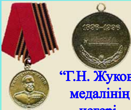
“Г.Н. Жуков” медалінің иегері.