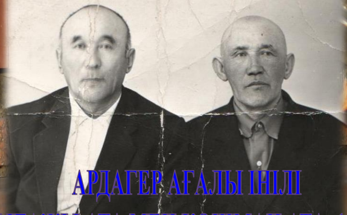
АРДАГЕР АҒАЛЫ ІНЛІ БАҚТЫҒАЖЫ АТА МЕН ҚОШМАН АТА. 1986 ЖЫЛ.