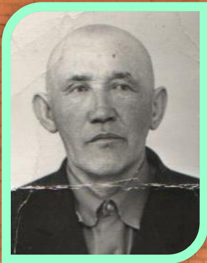
Қошыман атаның медальдары мен ордендері.