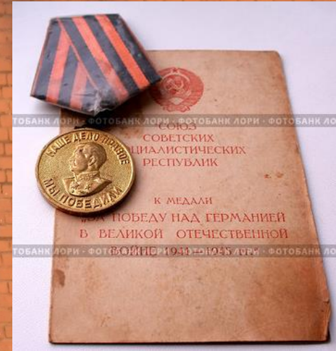
1941-1945 жж Германиямен соғыстағы Жеңісі үшін» медаль