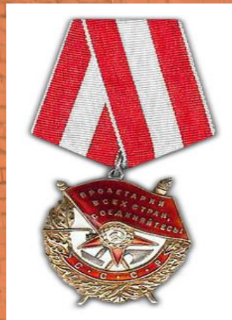
“Қызыл жұлдыз” орденінің иегері.