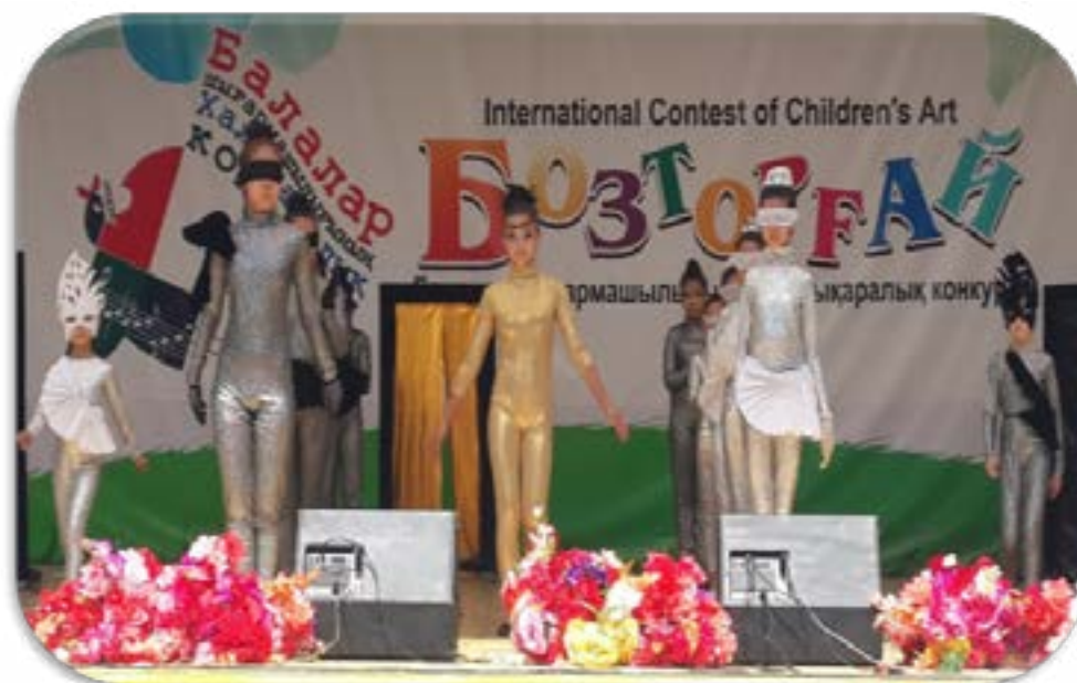
Коллекция «Черные и белые», 2018 г. (коллекция отражает вечную борьбу между добром и злом. В итоге «ДОБРО» побеждает «ЗЛО»).