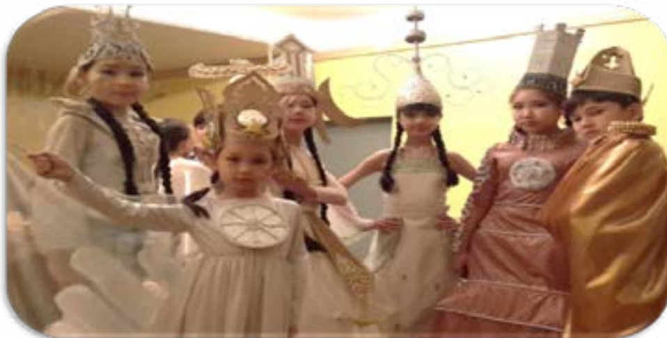
Коллекция «Елорда көші» заняла Гран-При в республиканском детском фестивале «БОЗТОРҒАЙ» - 2018 году.