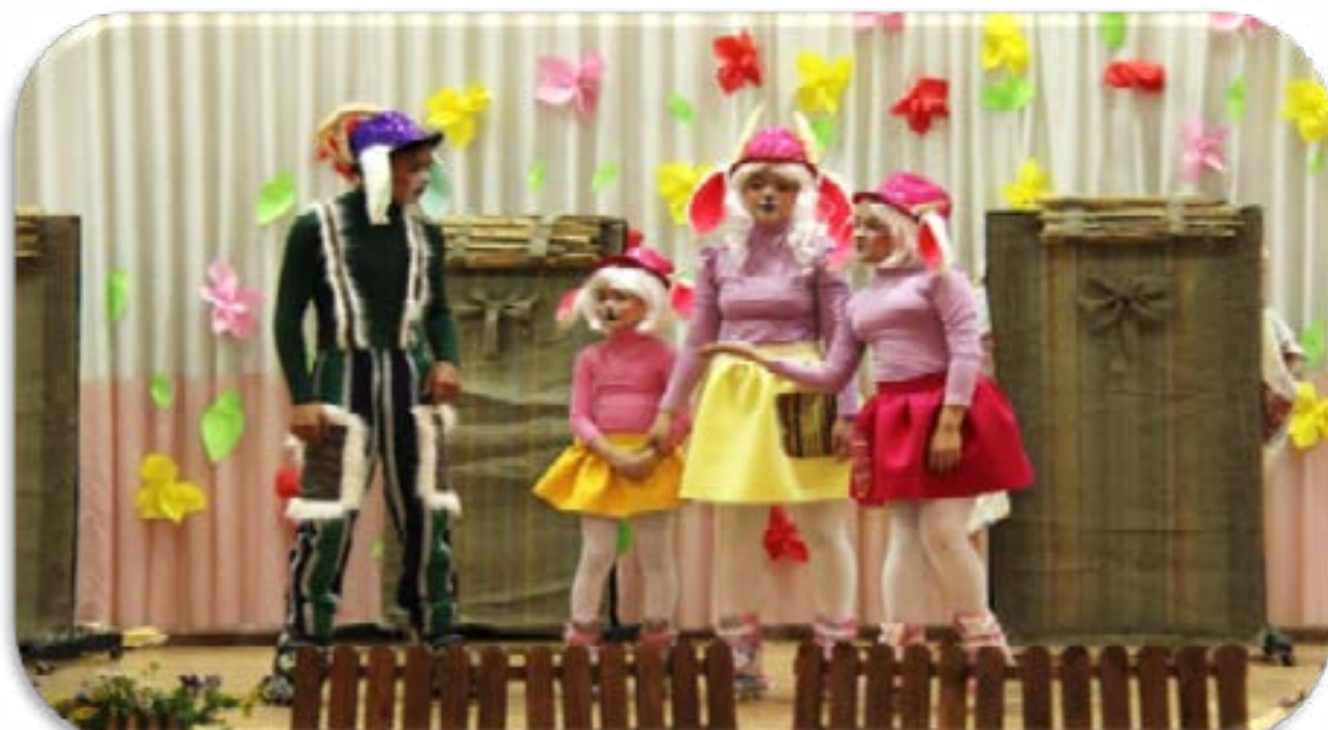
Спектакль «Семеро козлят» Спектакли театра «ТОЛАҒАЙ» Дома школьников №7 г.Алматы