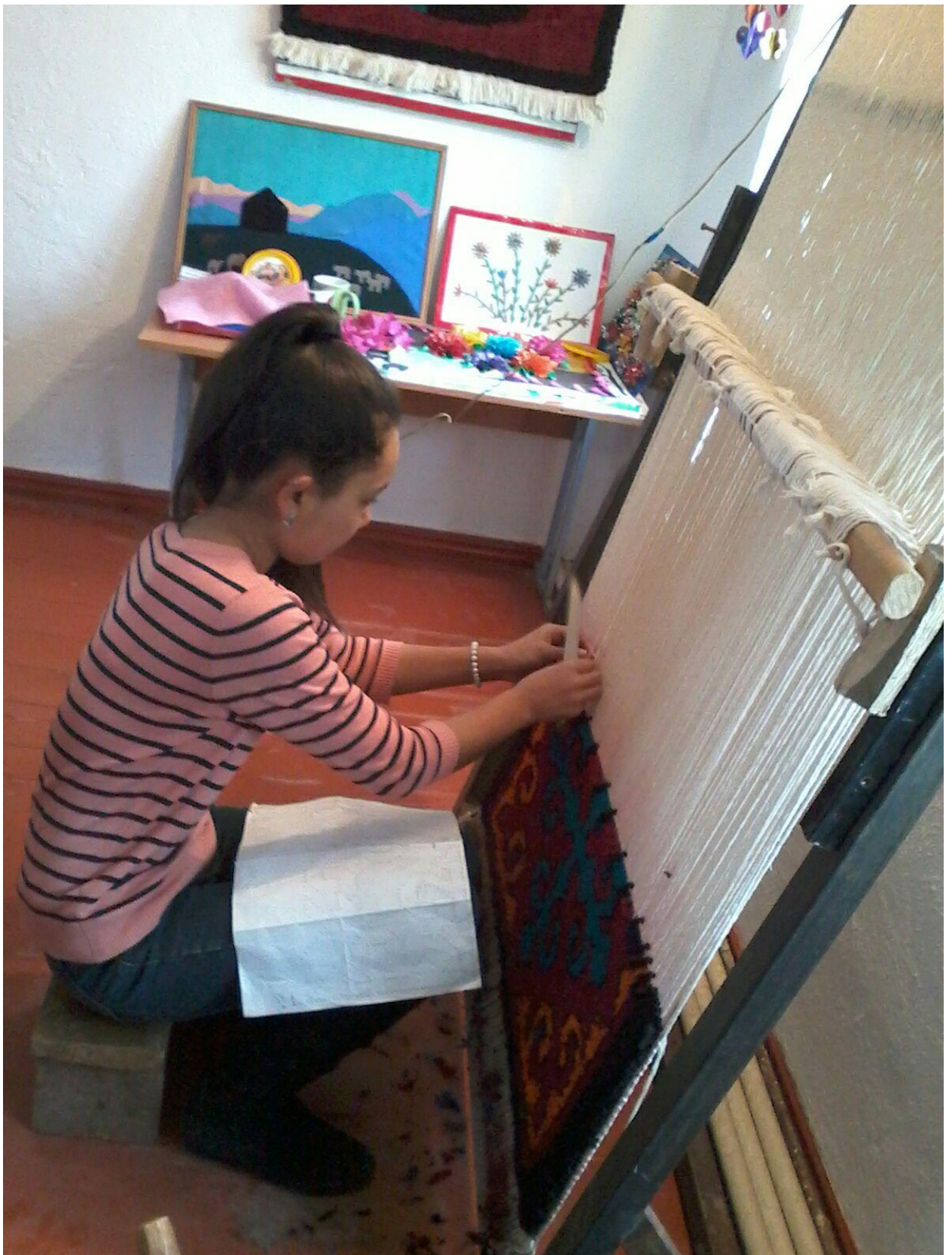
12-сурет. Жіпті шалу