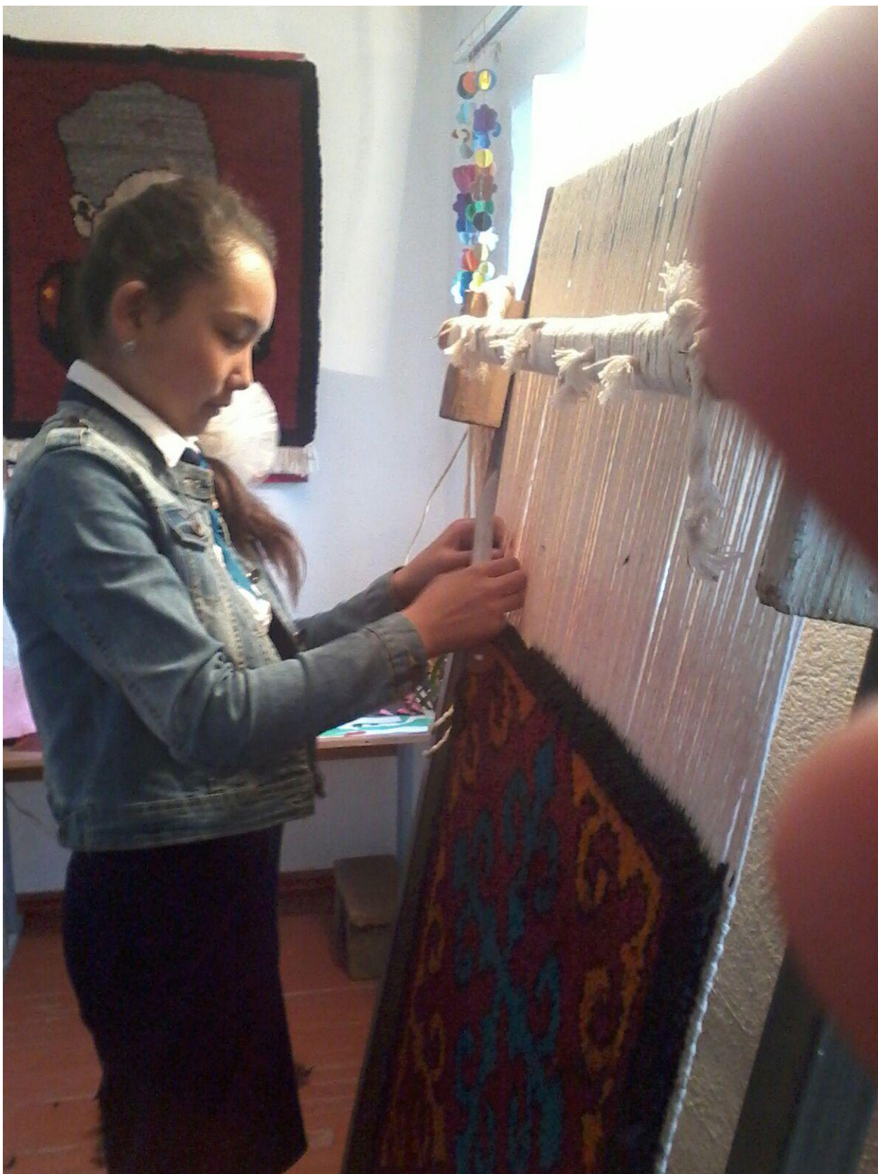
15-сурет. Кілемді аяқтау