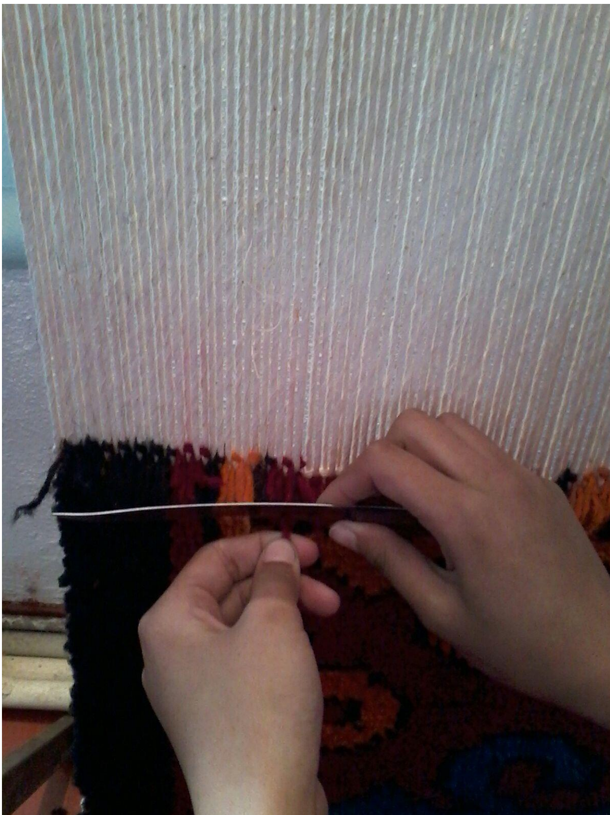
10-сурет. Шалынған жіпті пышақпен кесу