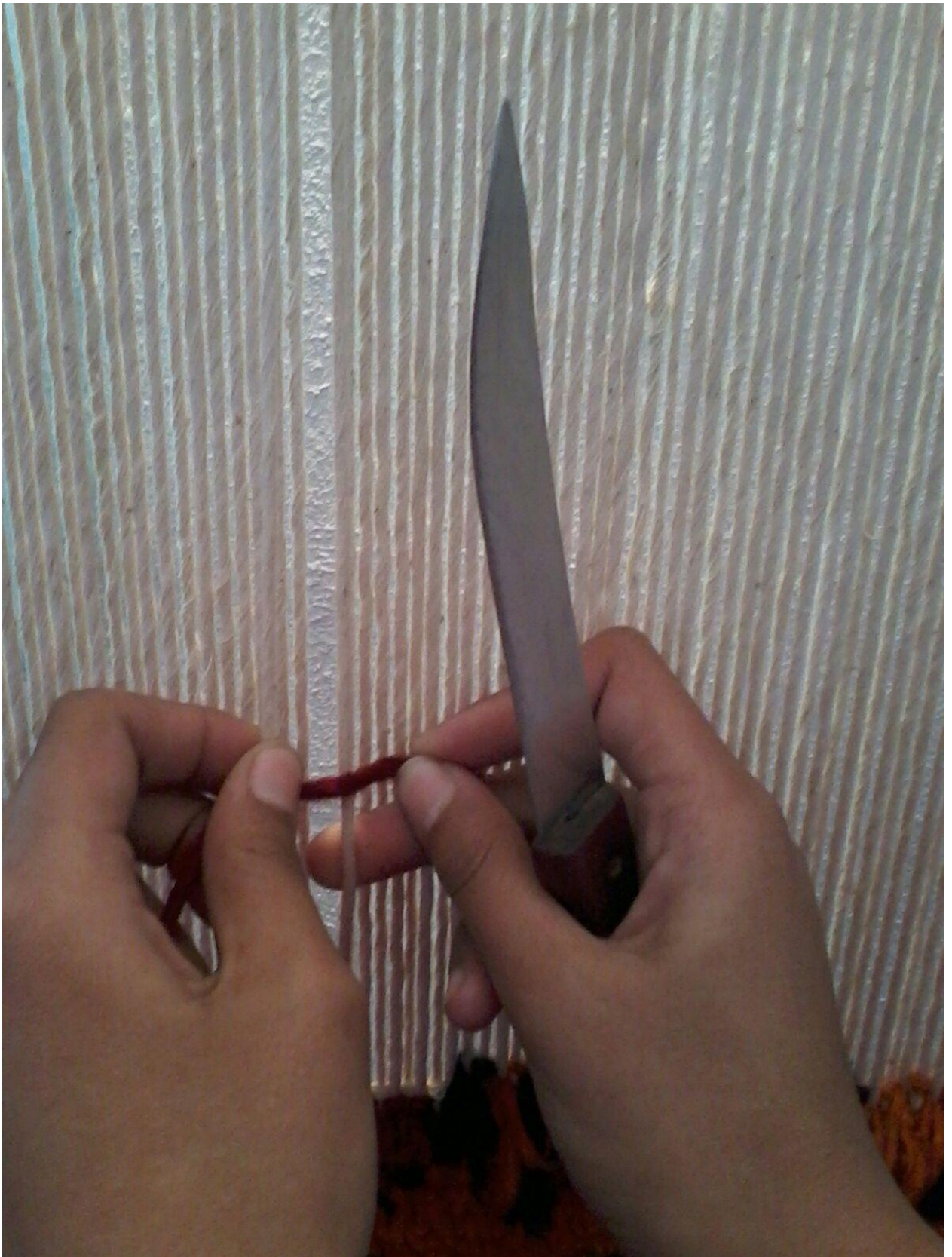
11-сурет. Жіпті шалу