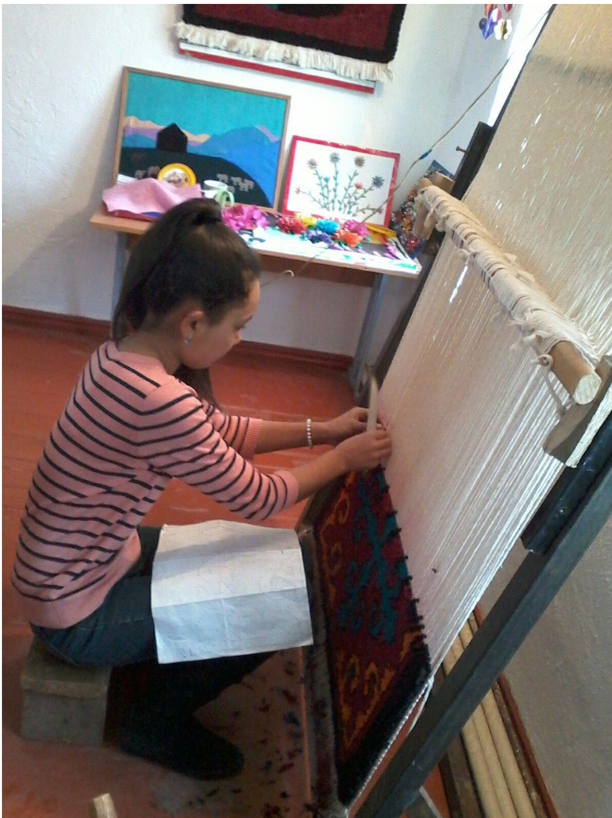
9-сурет. Үлгімен санап тоқу