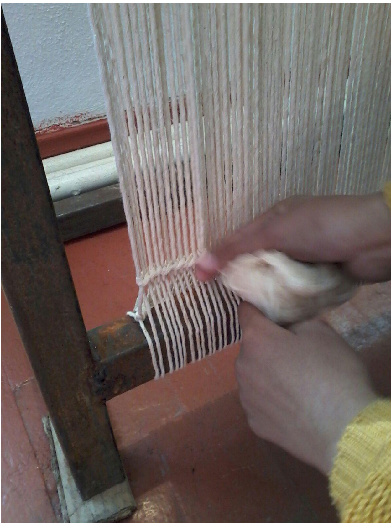
4-сурет. Кілемнің шетін түйіндеп байлау