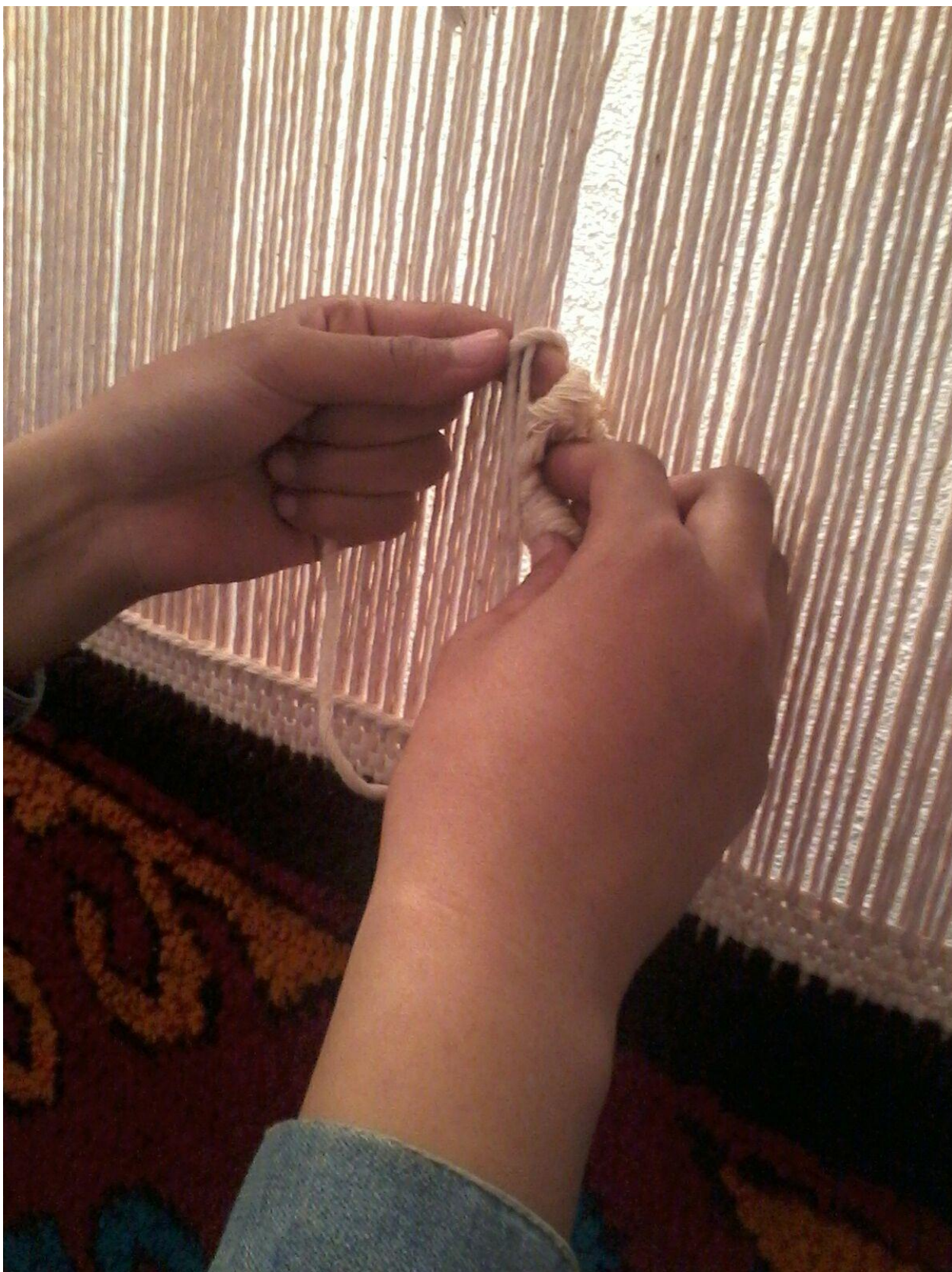
17-сурет. Кілемнің шетін түйіндеп байлау