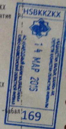
Төленгені туралы квитанция