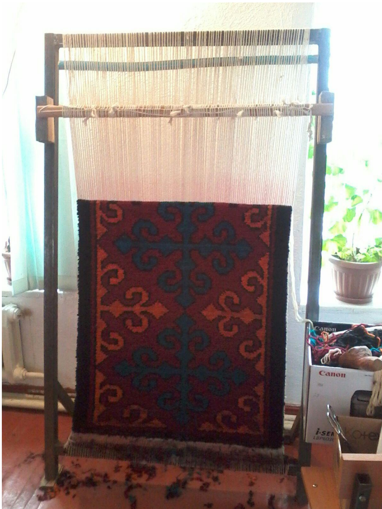
14-сурет. Бітудің алдындағы бейнесі