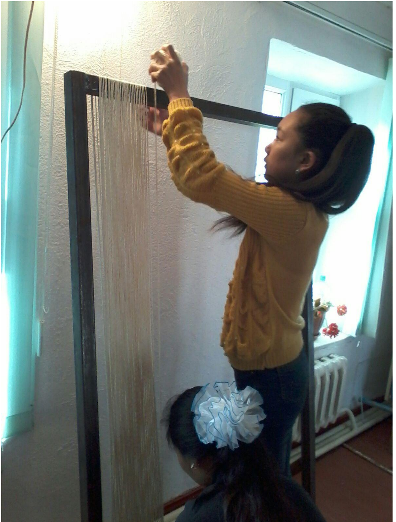
1-сурет. Кілемің желісін орау