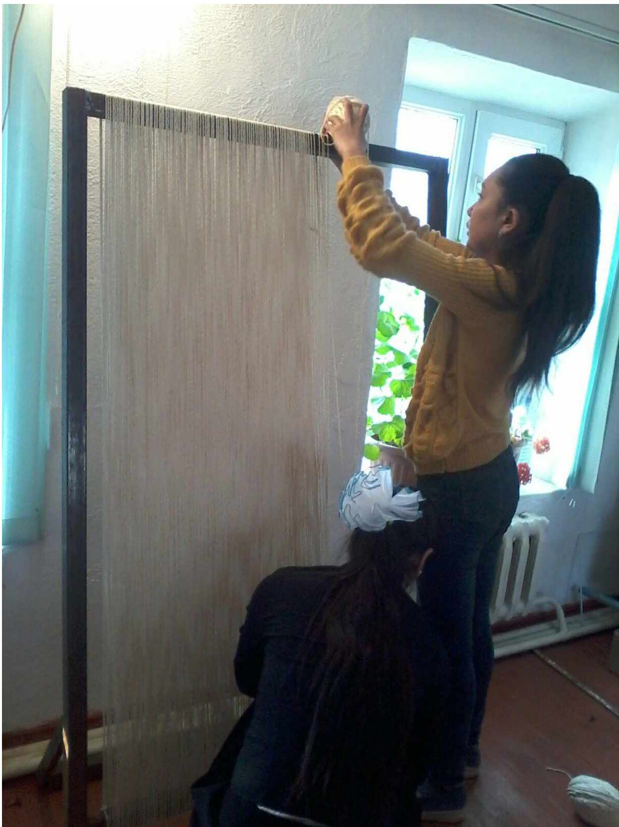
2-сурет. Кілемнің желісін орауды аяқтау