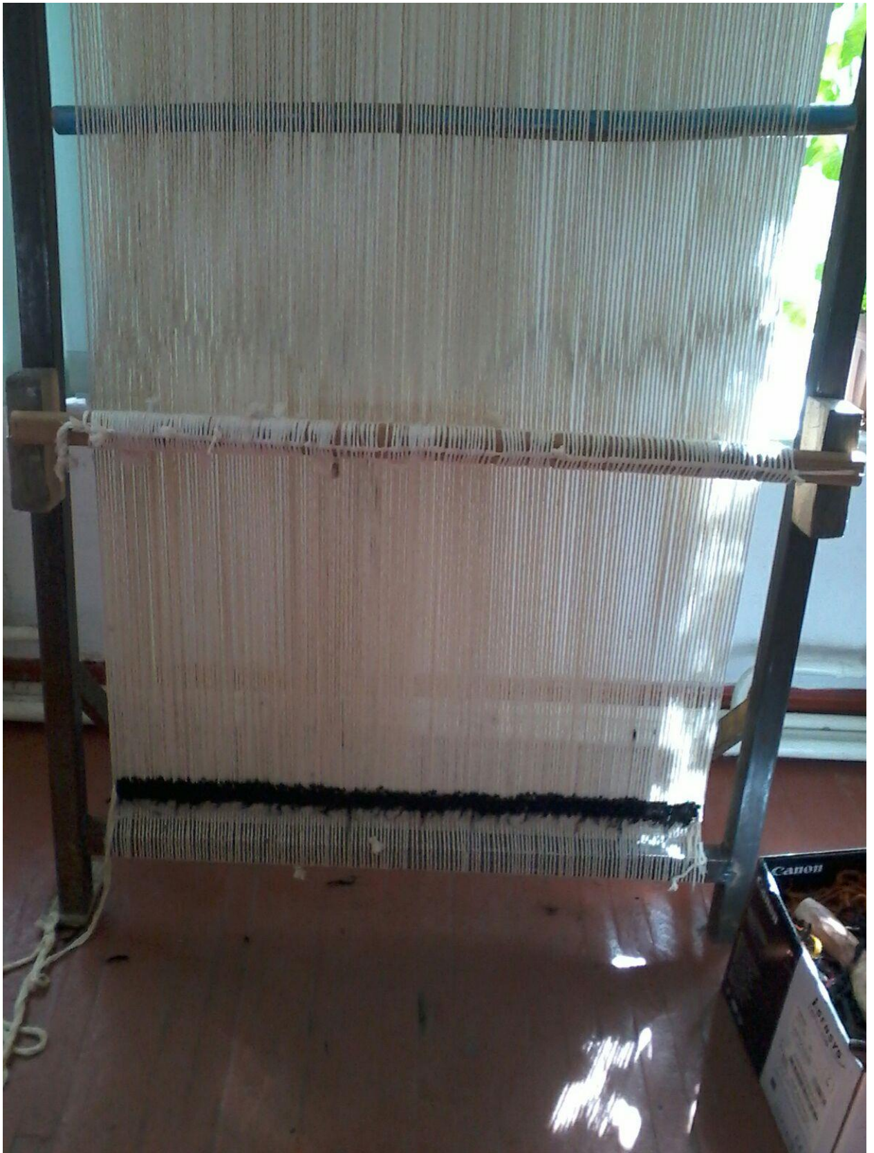
7-сурет. Кілемнің шеткі тақтасын бастау