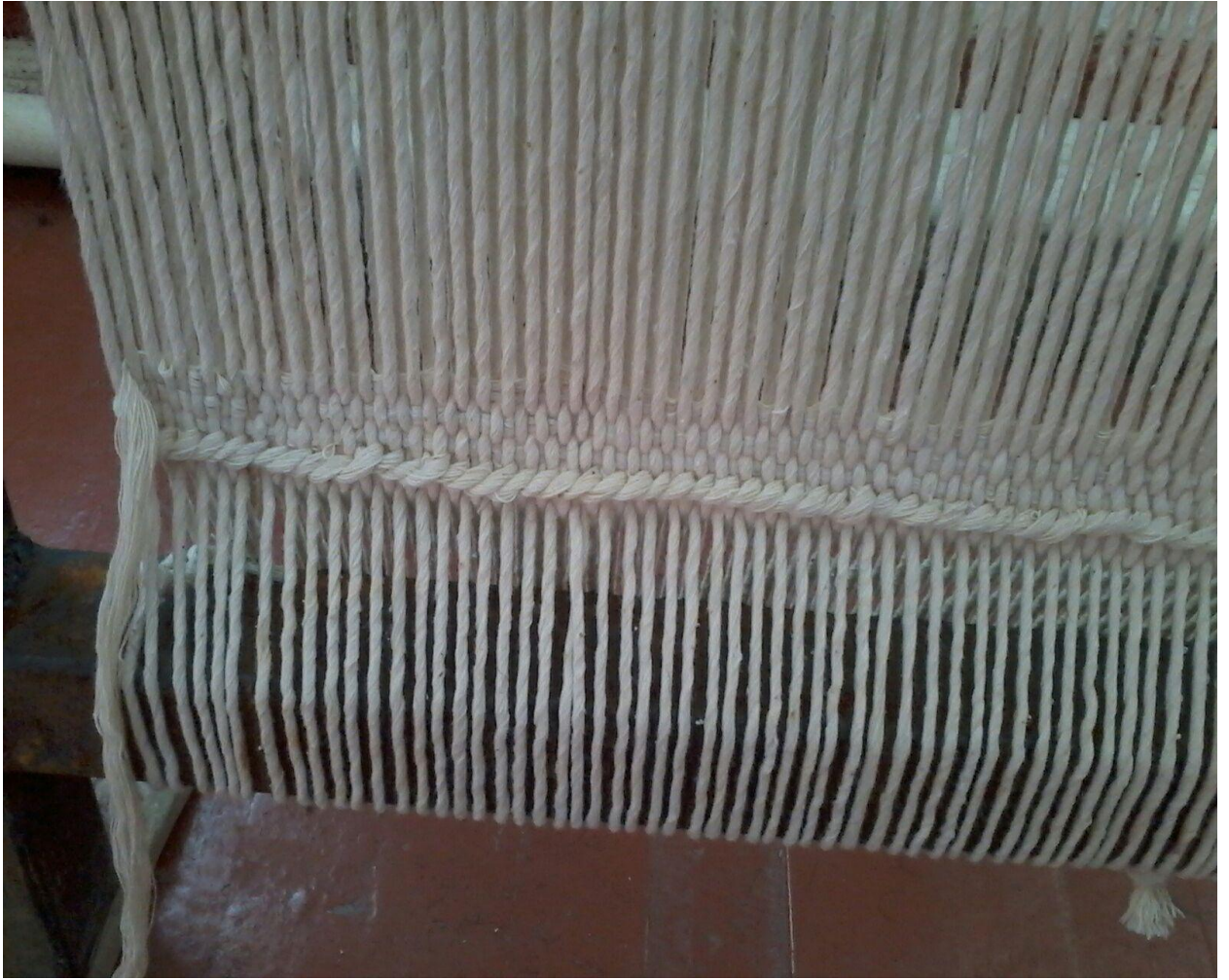
5-сурет. Кілемнің шетін арқаумен бекіту