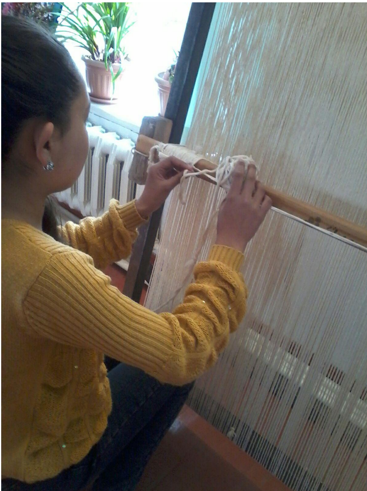
3-сурет. Кілемнің күзу жібін байлау