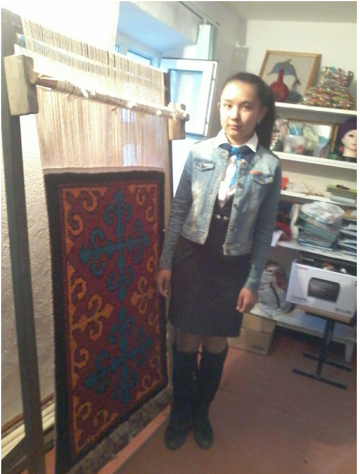
19-сурет. Кілемнің біткен сәті