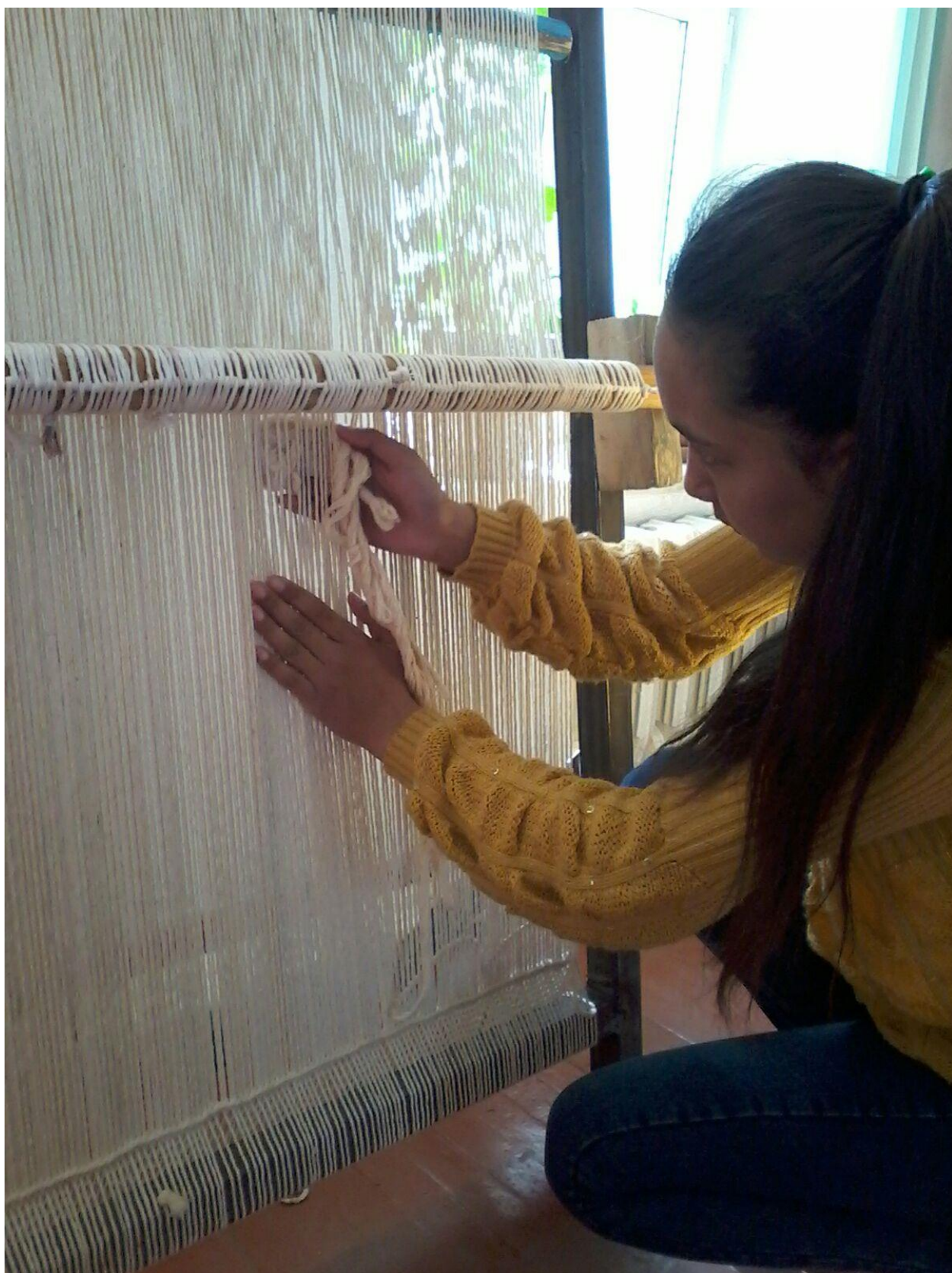
6-сурет. Арқау өткізу