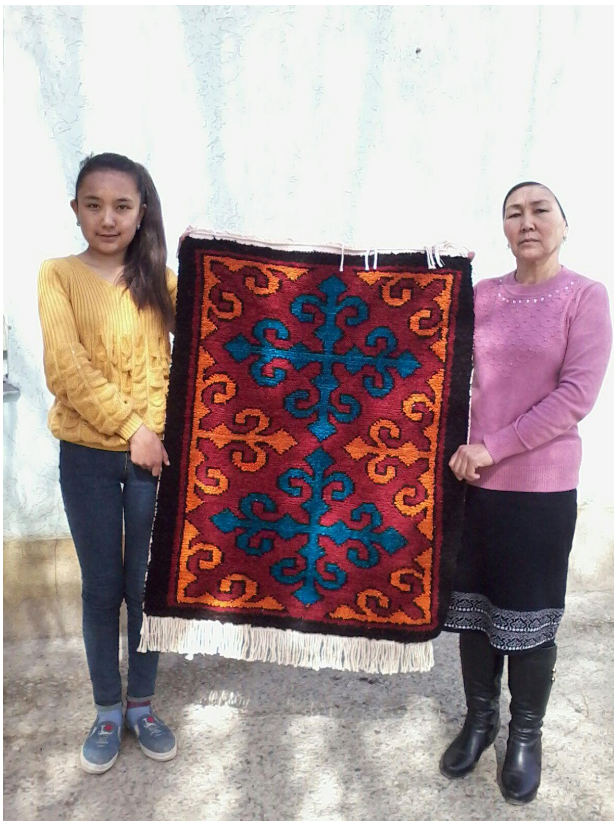
20-сурет. Оқушы мен жетекші дайын кілемнің қасында