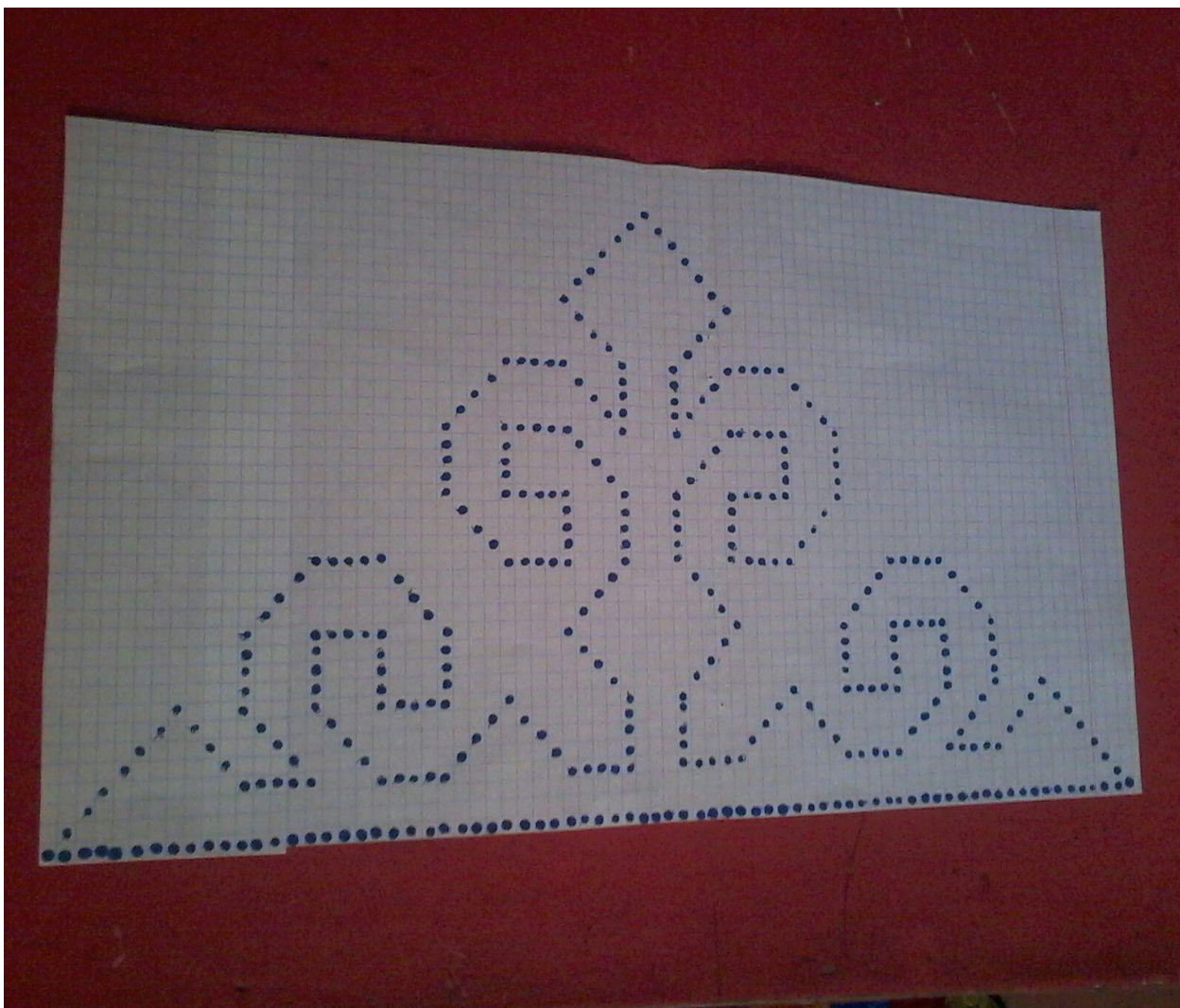
8-сурет. Кілемге салынатын оюдың үлгісі