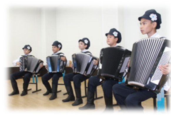
Баяншылар мен аккордеонистер ансамблі

«Өзгеніңдертіменқайғысынбізжүрегімізбен сеземіз» деген ұранмен мектебіміздің жас таланттары өте жоғары деңгейде қайырымдылық концерттер ұйымдастырып, шарадан түскен қаражатпен ауыр дертке ұшыраған өздері сияқты жас балаларға көмек қолын созу игі дәстүрге айналып келеді. Бұндай қамқорлық, әрине, имандылыққа тәрбиелейді.