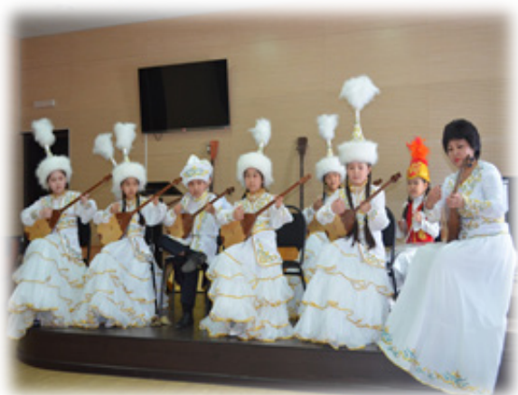
«Жас толқын» домбырашылар ансамблі