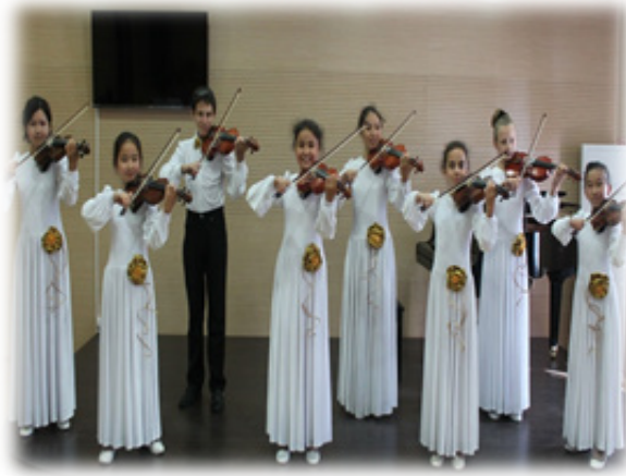
«Жас толқын» домбырашылар ансамблі