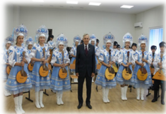
Орыс халық аспаптар оркестрі