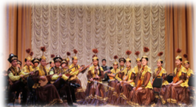
Қазақ халық аспаптар оркестрі

Ең бастысы, оқушылар бұл ұжымдарда бірлесіп жұмыс істеп, «бірліктің түбі – береке» екендігін жақсы түсінеді. Музыка мектебі Екібастұз қаласындағы жиырмадан астам орта білім беретін мектептен 650 оқушыны бір арнаға тоғыстырып, ортақ мүддеге біріктіріп отыр.